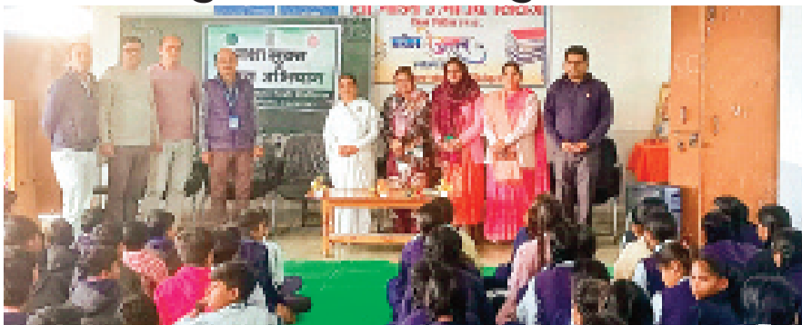
हरिभूमि न्यूज ►►सिरोंज

शासकीय मॉडल हाई सेकेंडरी स्कूल में व्यसन मुक्ति का कार्यक्रम का आयोजन किया गया। इस अवसर पर व्यसन मुक्ति कार्यक्रम में विशेष तौर पर छात्र और छात्राओं और स्कूल के सभी स्टाफ में बंद-चढ़कर भाग लिया। तो वहीं राजयोगिनी बीके सरस्वती दीदी ने बच्चों को नशा मुक्त रहने की प्रेरणा दी गई और बच्चों को बताया कि अपनी विचारों को सशक्त बनाएं अपनी आत्मा ऊर्जा को सशक्त बनाएं समय निकालकर मेंडिटेशन जरूर करें एकांत बस अपने जिससे हमारी आंतरिक ऊर्जा को हम समझ सके। बच्चों को बताया जीवन में नैतिक मूल्यों को का होना