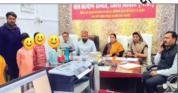
विदिशा। बच्चों और उनके पालकों को समझाया जाते हुए समिति पदाधिकारी।

बाल भिक्षावृत्ति रोकथाम अभियान के तहत रामलीला मेले में कार्रवाई की गई। महिला एवं बाल विकास विभाग की टीम ने भिक्षावृत्ति करते पाए गए 8 बच्चों को रोका और